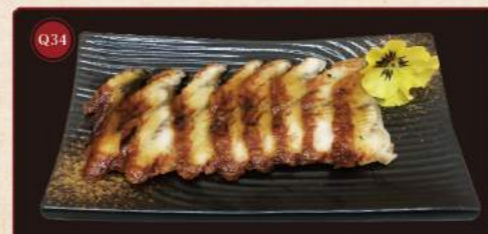
Úhoř 50g © 199,- Sea eel