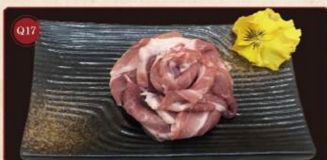
Vepřový krk* 100g © 199,- Pork chuck*