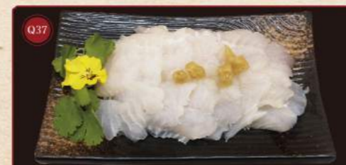
Vykostěná ryba Pangasius 150g © 169,- Boneless Pangasius fish