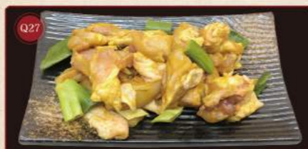
Orleánská kuřecí stehna 150g © 169,- Orleans chicken thigh