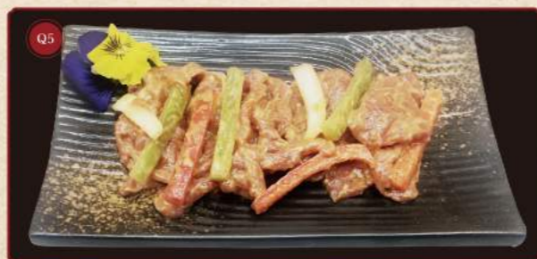
Vysoký roštěnec(rib eye) 100g © 259,- Thin cut rib eye