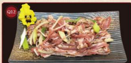
Jehněčí s čínským pórkem 100g © 199,- Sliced mutton with scallions