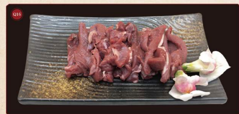
Marinované jelení maso 100g © 169,- Marinated venison