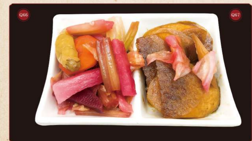
Sečuánské kimči © 49,- Nakládaná ředkev © 49,- Sichuan kimchi Pickled radish