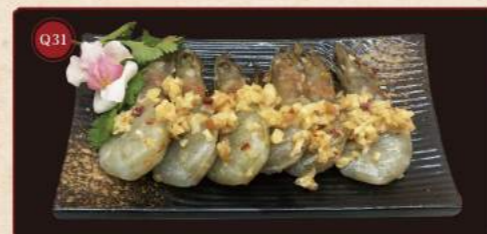
Pikantní krevety s česnekem 6 kusů © 299,- Spicy prawn with garlic 6pcs © 299,-