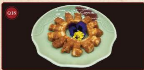
Marinovaný bok 150g © 169,- Marinated thick cut pork belly