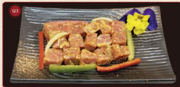
Marinovaný hovězí filet 100g © 299,- Thịt bò phi lê thượng hạng