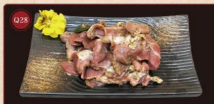
Kuřecí gizzard 150g © 169,- Chicken Gizzard