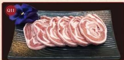
Skopový závitok* 100g © 199,- Original cut mutton roll*