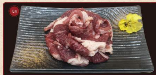
Hovězí žebírka 100g © 259,- Beef plate ribs*