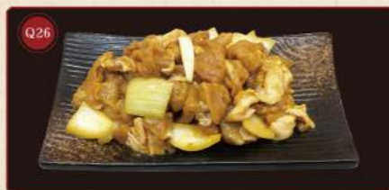
Kuřecí stehna na kari 150g © 169,- Curry chicken thigh