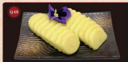
Bramborové lupínky 100g © 99,- Potato slices