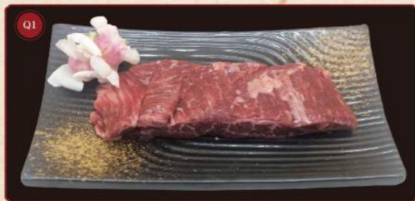
Filet mignon* 100g © 399,- Tenderloin*