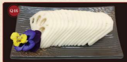
Kousky lotosových kořenů 100g © 199,- Lotus root slices