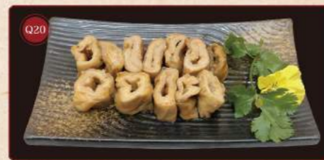
Vepřové tlusté střevo 100g © 139,- Pork intestine