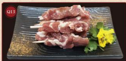
Speciální skopový kebab 120g © 169,- Secret mutton shashlik