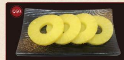
Plátky ananasu 100g © 99,- Pineapple slices