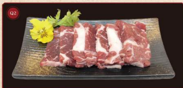
High-rib hovězí* 100g © 299,- High rib beef*