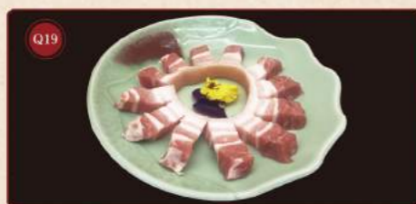
Bok* 150g © 169,- Original thick cut pig belly*