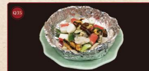
Malé mořské plody s plechovým papírem 150g © 199,- Tiny Seafood with tin foil