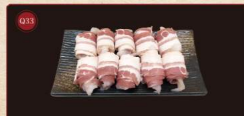
Rolky se slaninou a krevetami 10 kusů © 239,- Bacon shrimp roll 10 pcs © 239,-