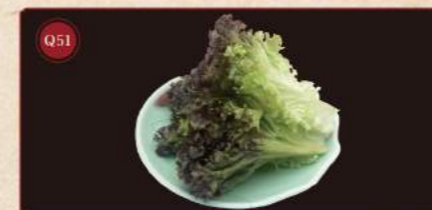
Salát 150g © 99,- Lettuce