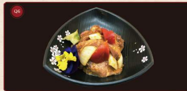
Hovězí jazyk 100g © 299,- Beef tongue