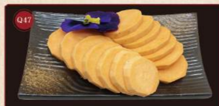
Sladké bramborové lupínky 100g © 169,- Sweet potato slices