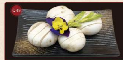
Houba 100g © 99,- Mushroom